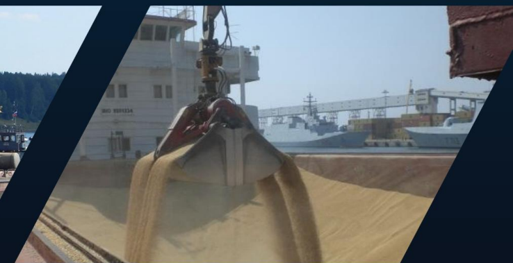
Перевозка продуктов питания для с/х деятельности