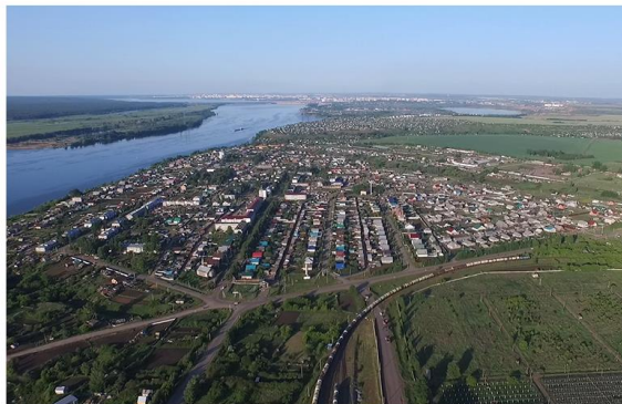
Удобное географическое положение