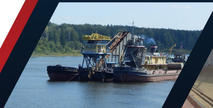
Добыча, переработка речного песка и песчано-гравийной смеси