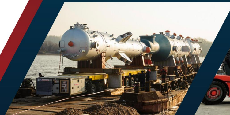
Негабаритные и накатные грузы