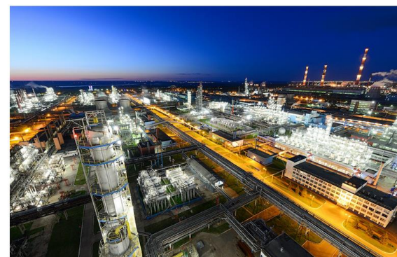
Близость рынков сбыта и трудовых ресурсов