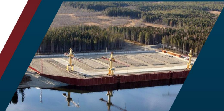
Вариант проекта постройки.