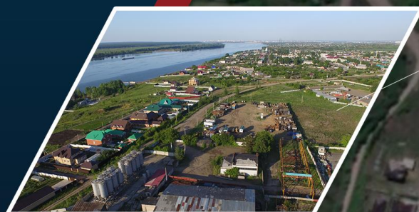
Расширение земельных участков