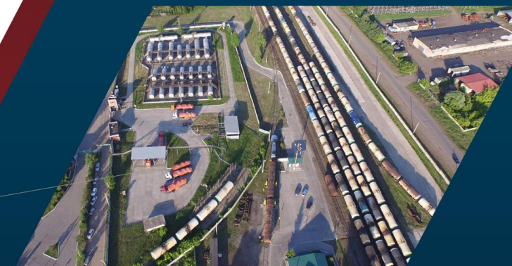
Площадь 1,4 Га