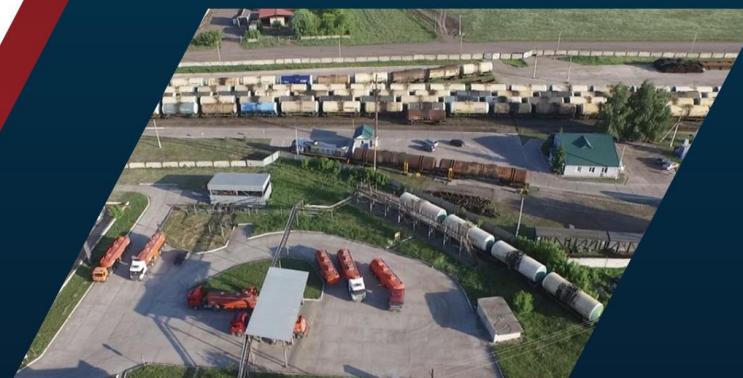
Автоматическая система налива