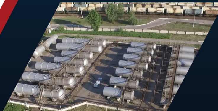
Резервуары V- 2 600 м3