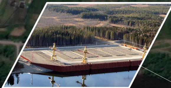
Возможность строительства грузового причала